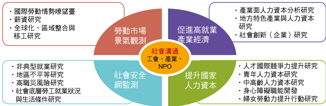
圖 1 勞動市場中長程研究策略架構圖

網站內涵以研究發展為主軸，中長程策略規劃以「勞動市場景氣觀測」、「促進高就業產業經濟」、「提升國家人力資本」、「社會安全網監測」等 4 項發展策略為主，並結合工會、產業與 NPO 非營利組織（Nonprofit Organization）等團體，強化「社會溝通」基礎。勞動市場中長程研究策略分述如下說明，架構