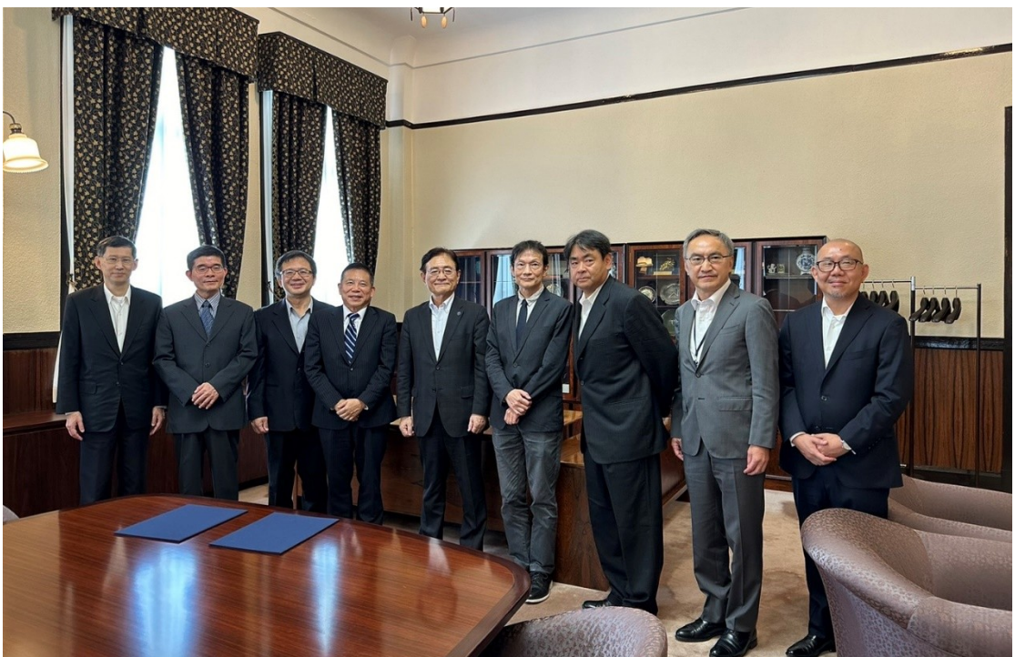
圖 2: 國發會劉鏡清主委(左四)、詹方冠副主委(左三)、國發基金汪庭安執行秘書(左二)、國發會產業發展處蕭振榮處長(左一)以及京都大學湊長博校長(右五)、江上雅彥副校長(右四)、