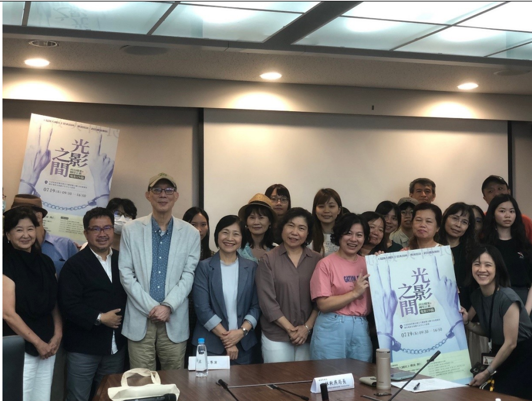
萬仁導演與參與者合影