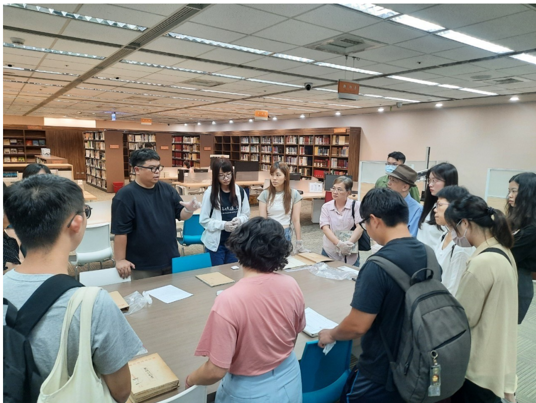
參與者於國家檔案閱覽中心瞭解政治檔案的應用方式