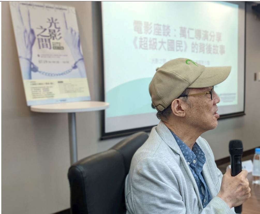
萬仁導演分享《超級大國民》製作時背後不為人知的祕辛