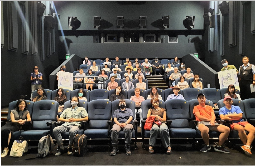
本活動於國家電影及視聽文化中心觀賞《超級大國民》數位修復版