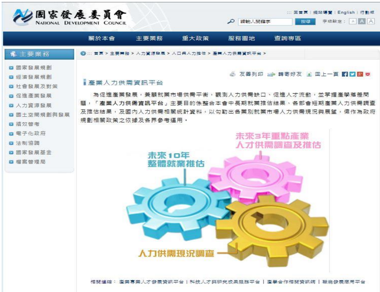
圖 1 國發會產業人力供需資訊平台 入口網址:www.ndc.gov.tw