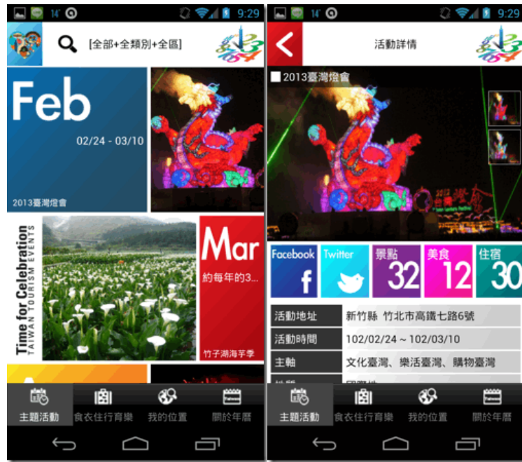
圖 9 交通部觀光局「臺灣觀光年曆 Taiwan Tourism Events」行動應用服務操作介面