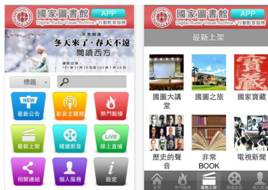
圖 4 「國圖行動影音」行動應用服務操作畫面示意圖 (資料來源：國家圖書館)

國家圖書館結合無線網路環境、完善的軟硬體設施及行動應用服務，使館內各項服務打破時間及地點限制，更可主動遞送讀者所須的圖書資訊服務。