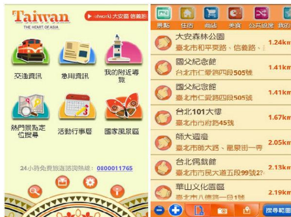
圖 8 交通部觀光局「旅行臺灣 Tour Taiwan」行動應用服務操作介面

觀光局整合 iTaiwan 無線網路、「旅行臺灣 Tour Taiwan」及「臺灣觀光年曆 Taiwan Tourism Events」等 App，獲得國際肯定，亦勇奪 2014 年全球旅遊資訊科技聯盟 (IFITT) 的觀光創新獎首獎，讓我國觀光首度站上世界舞臺。