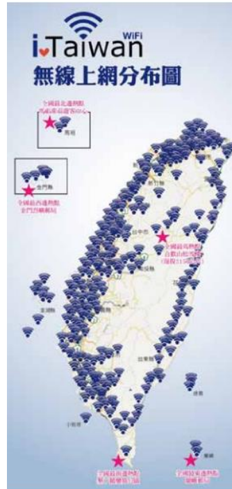
圖 1 iTaiwan 無線上網分布圖

目前全國最東邊、最西邊無線上網地點分別為交通部蘭嶼郵局、金門烈嶼郵局，服務到離島；全國最南邊則是內政部墾丁鵝鑾鼻公園，最北邊為交通部馬祖東引遊客中心，觀光旅遊景點不可少，至全國最高海拔無線上網地點則為農委會東勢林區管理處合歡山松雪樓，標高 3,150 公尺。