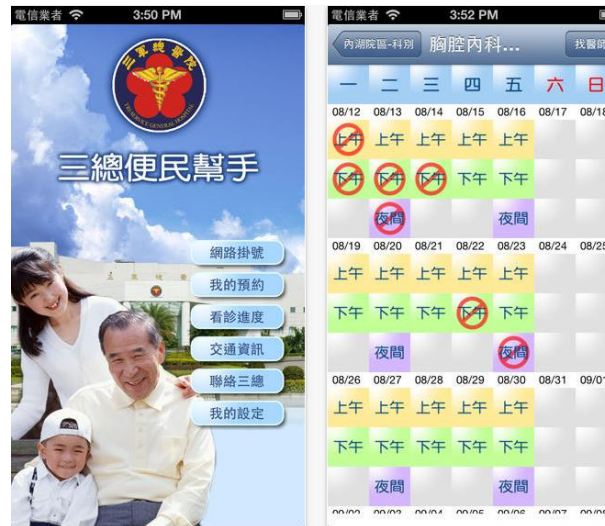
圖 2 國防部三軍總醫院「三總便民幫手」行動應用服務操作畫面示意圖