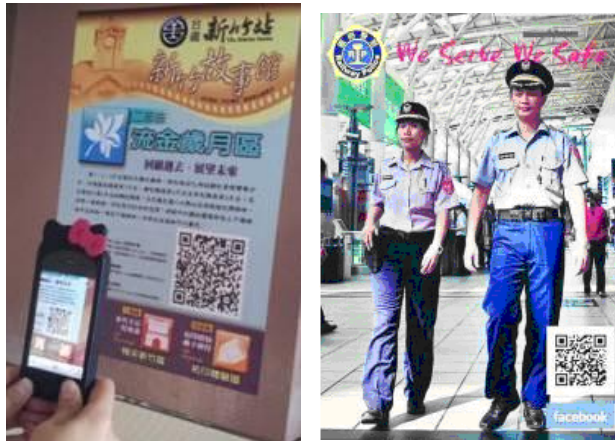
圖 3 台灣鐵路局及內政部警政署鐵路警察局二維條碼(QR Code)行動導覽服務