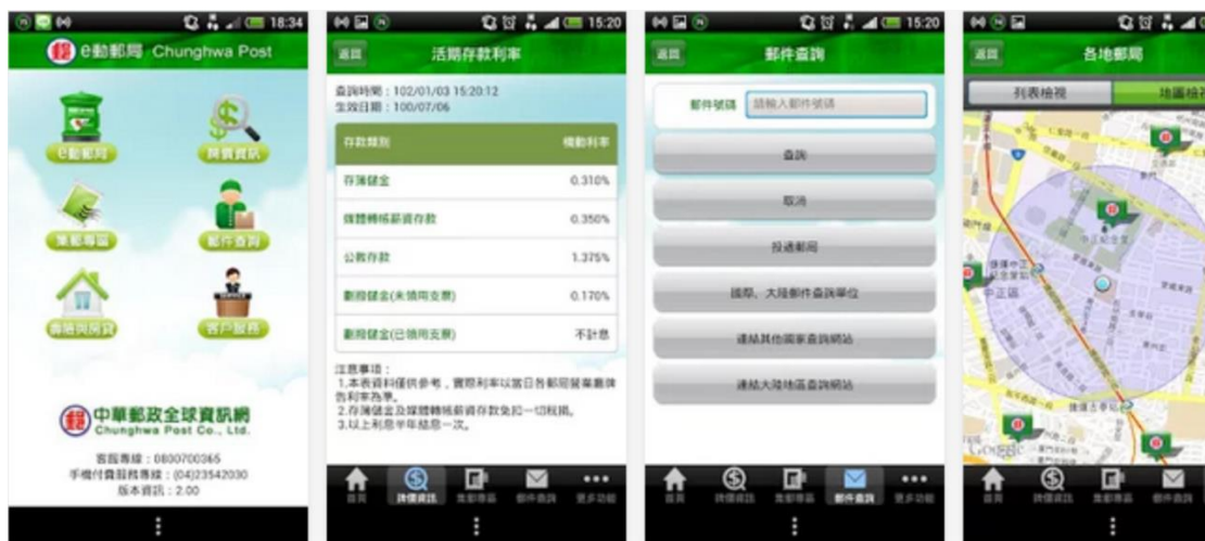
圖 5 中華郵政公司「e 動郵局」行動應用服務

中華郵政公司結合無線網路及「e 動郵局」行動應用服務，使民眾赴郵局洽公更加便利，提升軟硬體設施完備性，達成「尊榮郵感，全民郵享」的服務品質。