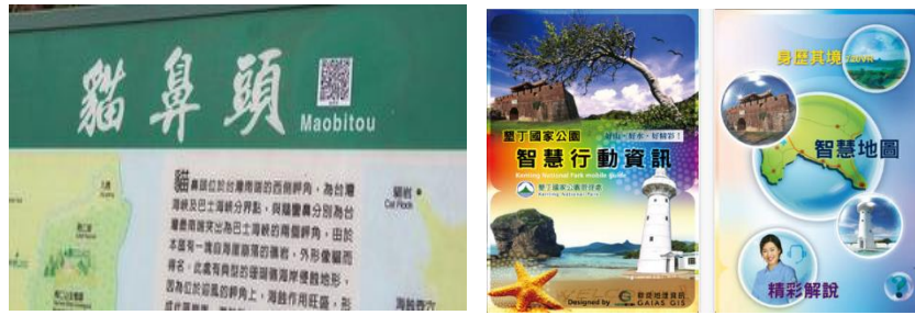
圖 6 墾丁國家公園管理處「智慧墾丁」行動應用服務及二維條碼(QR Code)旅遊導覽資訊(資料來源：墾丁國家公園管理處)