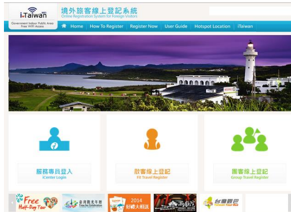
圖 7 iTaiwan 境外旅客線上登記系統 (網址： http://itaiwan.taiwan.net.tw/ )