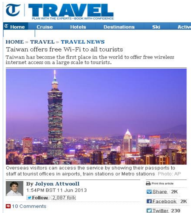
圖 10 英國每日電訊報(The Daily Telegraph)於 102 年 6 月 11 日報導「臺灣成為全球第一個全國性規模提供 WiFi 給觀光客使用的地方之一」(資料來源：The Daily Telegraph)