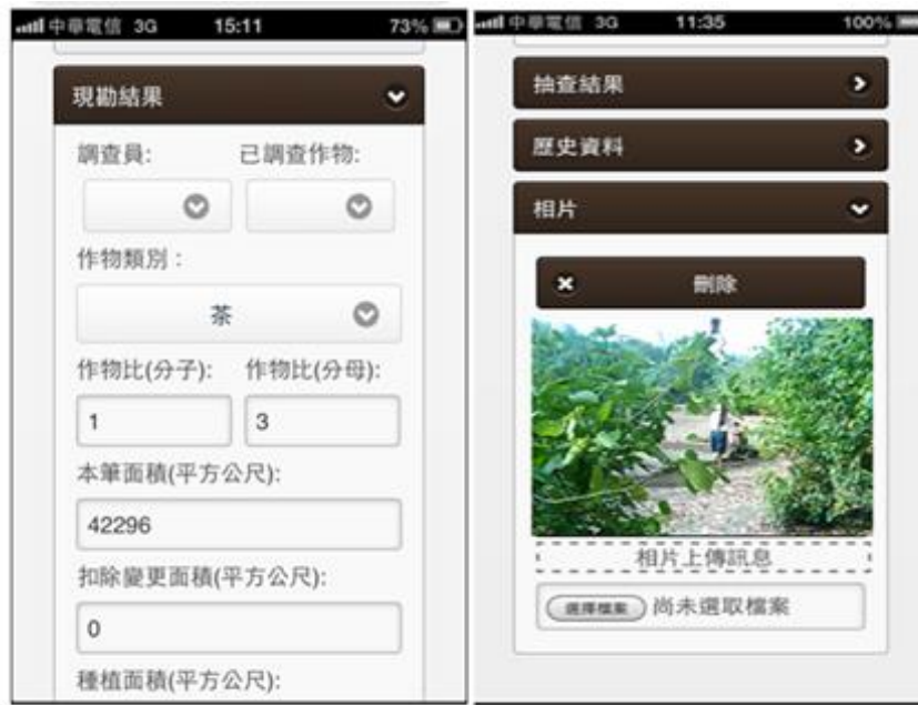
圖 2 行動化敏感作物調查系統（網路版）系統畫面