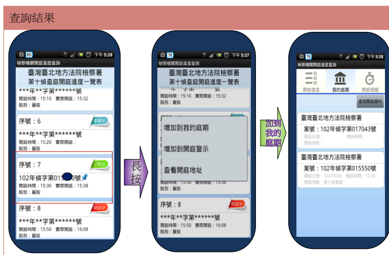
圖 5 APP 查詢結果示意圖