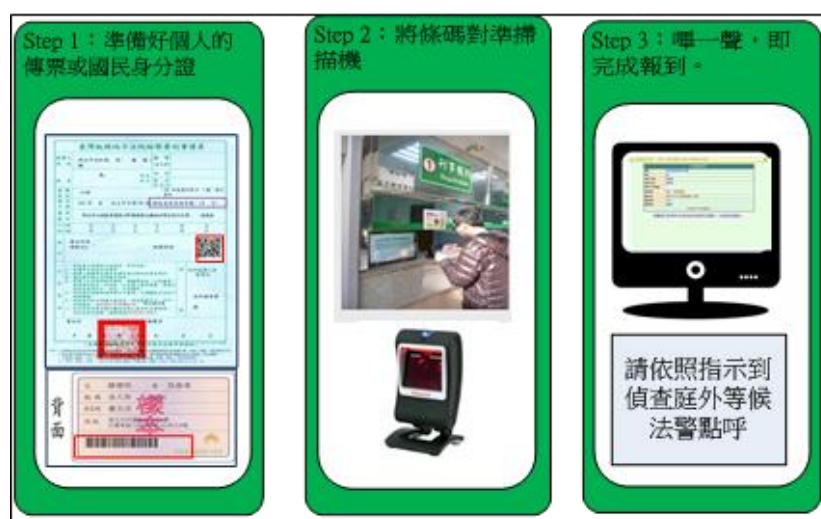
圖 2 當事人報到自動化操作流程