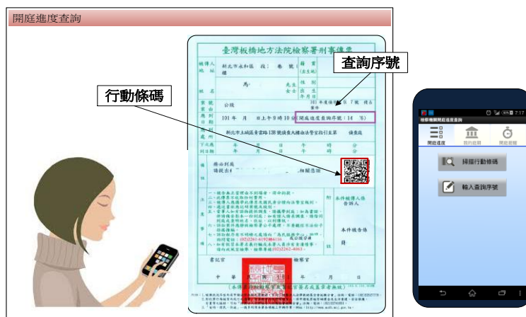
圖 4 開庭進度查詢操作示意圖