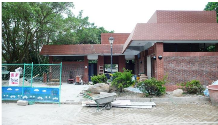
圖 4 福隆停車場公廁整建工程

及增設設施，工程經費為 655 萬，103 年 10 月 5 日完工，辦理驗收中。