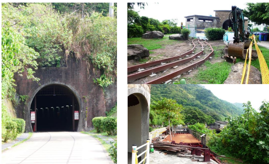
左圖：隧道南口現況；右圖：木棧道改善工程

(五) 舊草嶺自行車隧道南口友善空間改善工程：配合舊草嶺自行車道系統改善，主要工作項目為隧道南口木棧道無障礙改善工程、南口公園廁所無障礙改善工程、隧道南口涵洞排水及雜項工程，工程經費為 465 萬，預定進度 55%，實際進度 70%，超前 15 個百分點，預定 103 年 11 月 15 日完工。