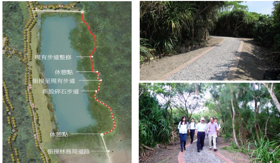
圖 2 頂寮公園環湖步道銜接工程

(二) 頂寮公園環湖步道銜接工程：本案原訂 103 年 8 月 9 日竣工，前因部分路段砂土潮濕導致嚴重沉陷，於施工發現後，配合回填砂土，致影響竣工日期，本案業於 103 年 8 月 22 日竣工。