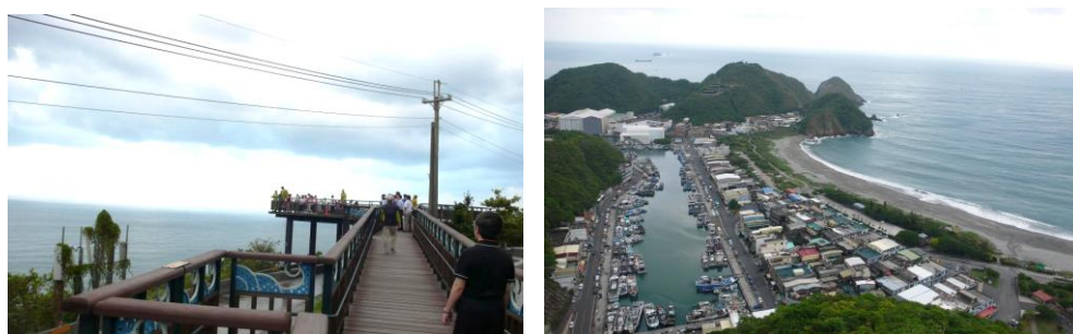
觀景臺無障礙坡道

(三) 南方澳觀景臺無障礙坡道工程：位於蘇花公路 108K 處南方澳觀景臺，經費為 348 萬，主要工作項目為無障礙木棧道、平臺及扶手，102 年 12 月 13 日完工使用。