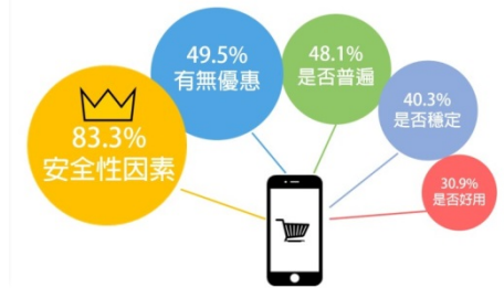
台灣民眾考量是否使用行動支付的前五名因素