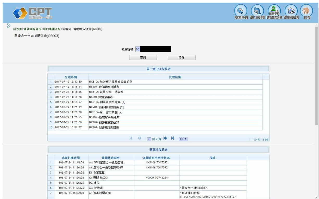
圖 5：單證合一申辦狀況查詢系統畫面

另為避免商民須經由不同管道、不同系統介面或人工洽詢方式，分別向簽審機關及海關查詢審理狀態及單證比對不符等明細資訊的困擾，海關於單一窗口提供簽審申辦狀態追蹤、通關簽審單證比對明細查詢及單證合一申辦狀況查詢等服務，商民可透過單一窗口集中式查詢介面，使用憑證即時查詢各簽審機關進出口案件審理狀態的明細資料，並可獲取海關報單與簽審資料比對結果明細資訊及單證合一申辦放行狀態，有效提供便利服務，節省商民作業時間及成本。