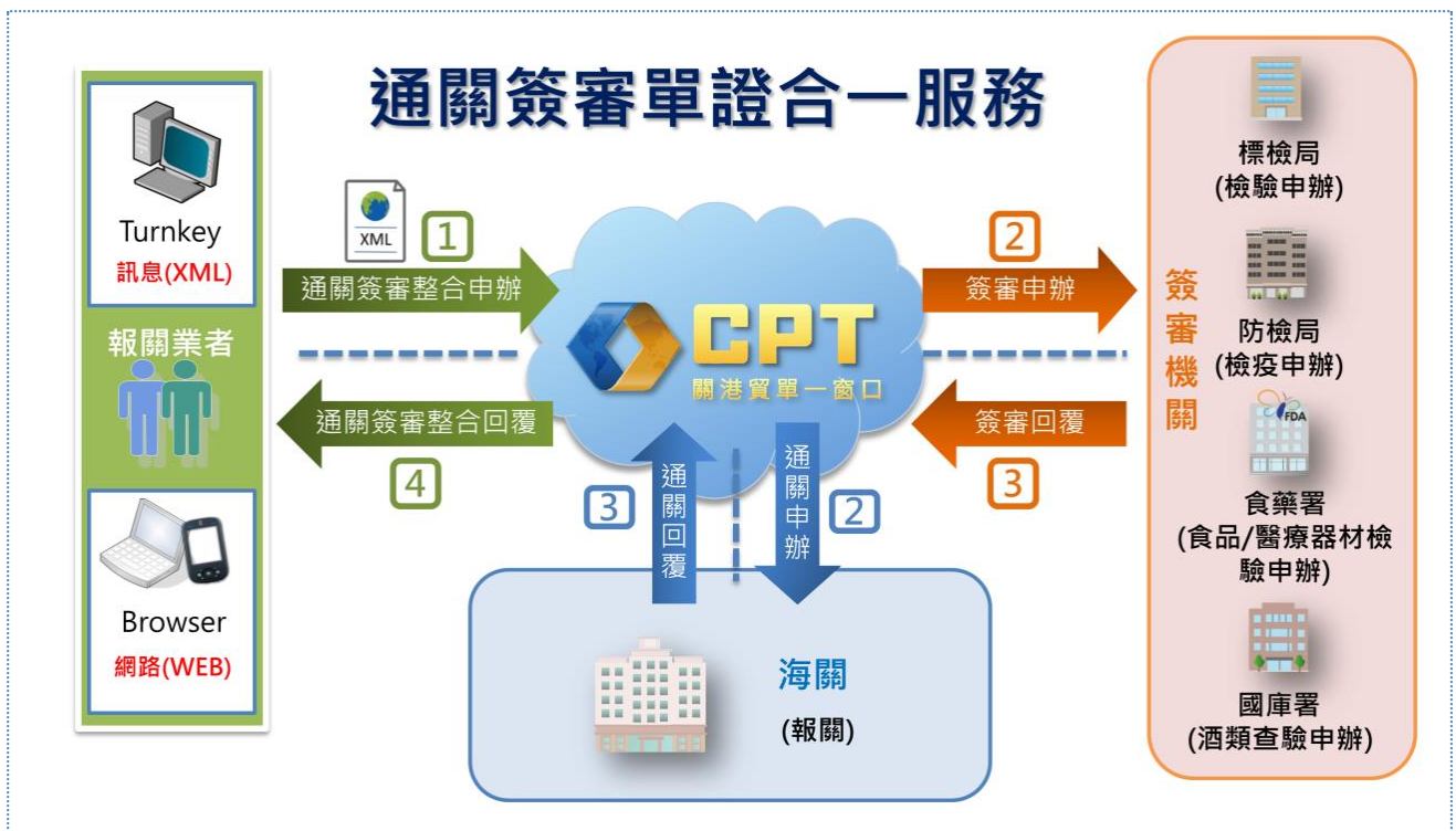
圖 2：通關簽審單證合一服務示意圖