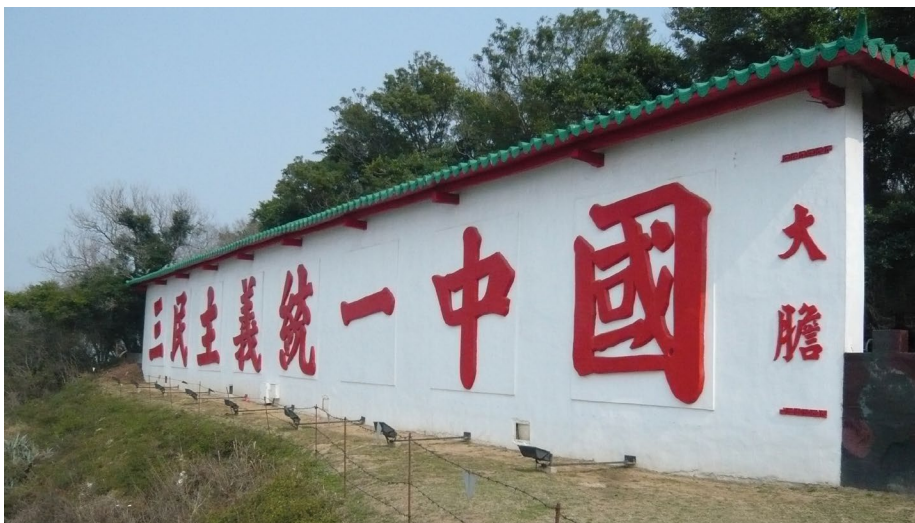
圖 6 大膽島心戰牆