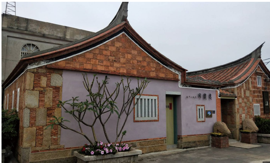
圖 3 傳統閩南建築

棟棟巍峨壯麗的洋樓（圖 5）說明僑親在功成名就後回饋故里的情懷。40 多年的戰場經營下，所建設之坑道、碉堡、軌條砦、播音站、戰役紀念物（圖 6），形成獨特的戰地風貌。長期以來，軍民胼手胝足，投入造林綠美化，使得昔日童山濯濯變成今日植被茂密，尤其鳥類種類多達近 300 種，是賞鳥人士的最愛。