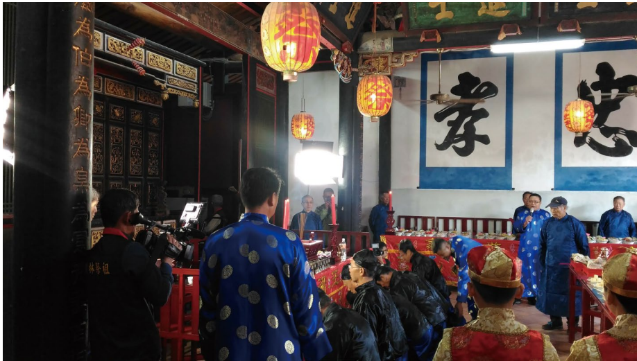
圖 4 金門傳統祭祖文化