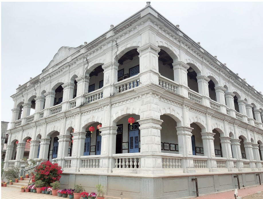
圖 5 陳景蘭洋樓