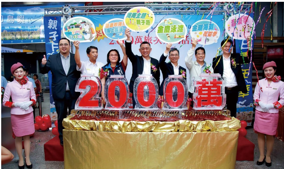
圖 1 小三通突破 2,000 萬旅次活動

從兩岸敵對冷戰時期的最前線及緩衝區，搖身一變成為兩岸融冰和平的試行區。1990 年 9 月 11 日，海峽兩岸紅十字會，在金門簽訂「金門協議」，建立海上遣返等協定，為 40 年來兩岸第一個協定。2001 年 1 月 2 日金門小三通啟航，2013 年突破 1,000 萬旅次，2019 年突破 2,000 萬旅次（圖 1），是金門另一番蛻變與成長（圖 2）。