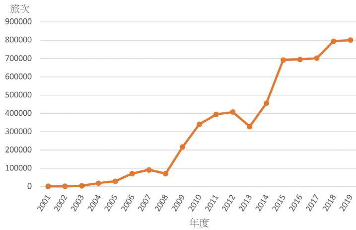
圖 7 大陸旅客透過小三通往返金門旅次