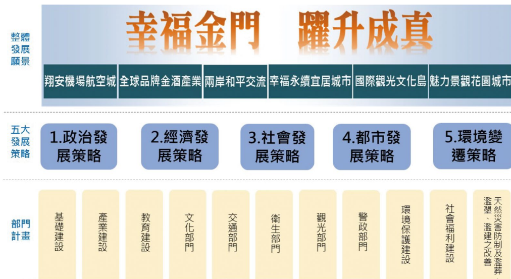
圖 9 金門縣整體發展願景圖

金門正處在發展的關鍵時刻，縣府團隊將持續朝「幸福金門·躍升成真」發展願景努力，打造金門成為幸福島嶼，讓兒童開心成長，讓長輩安心就養，讓青壯朋友們放心奮鬥，讓金門躍升成為海峽兩岸最亮眼的明珠。