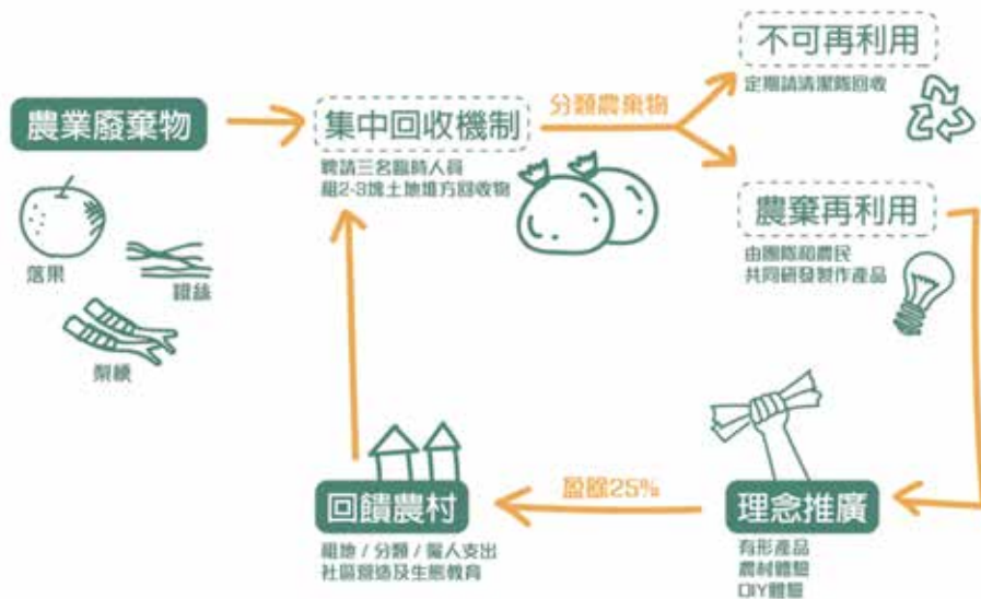
圖 2 農業廢棄物回收概念圖

因此，農委會積極輔導農村社區產業轉型企業化經營，並引導逐步轉型為社會企業，擴大對社會與環境的影響力。於 2015 年開始試辦農村社區企業經營輔導，2016 年為加速推動農村社區產業發展，農委會通過「農村社區企業經營輔導作業要點」，擴大農村企業輔導工作，針對農村社區產業相關已設立之企業，提供必要之專業育成輔導及資金補助，健全其企業組織與提升經營能量，帶動農村社區經濟成長；同時引導朝向社會企業發展，兼顧社區、環境及居民照護等社會責任。