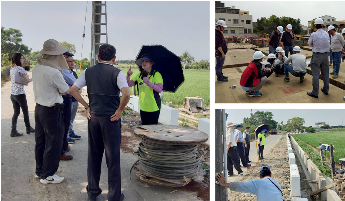
圖 3 邀集相關單位與提案人實地會勘，了解待改善之情況

自 2011 年至 2017 年區里座談會建議案總計 5,075 件，解除追蹤已占九成六左右，截至