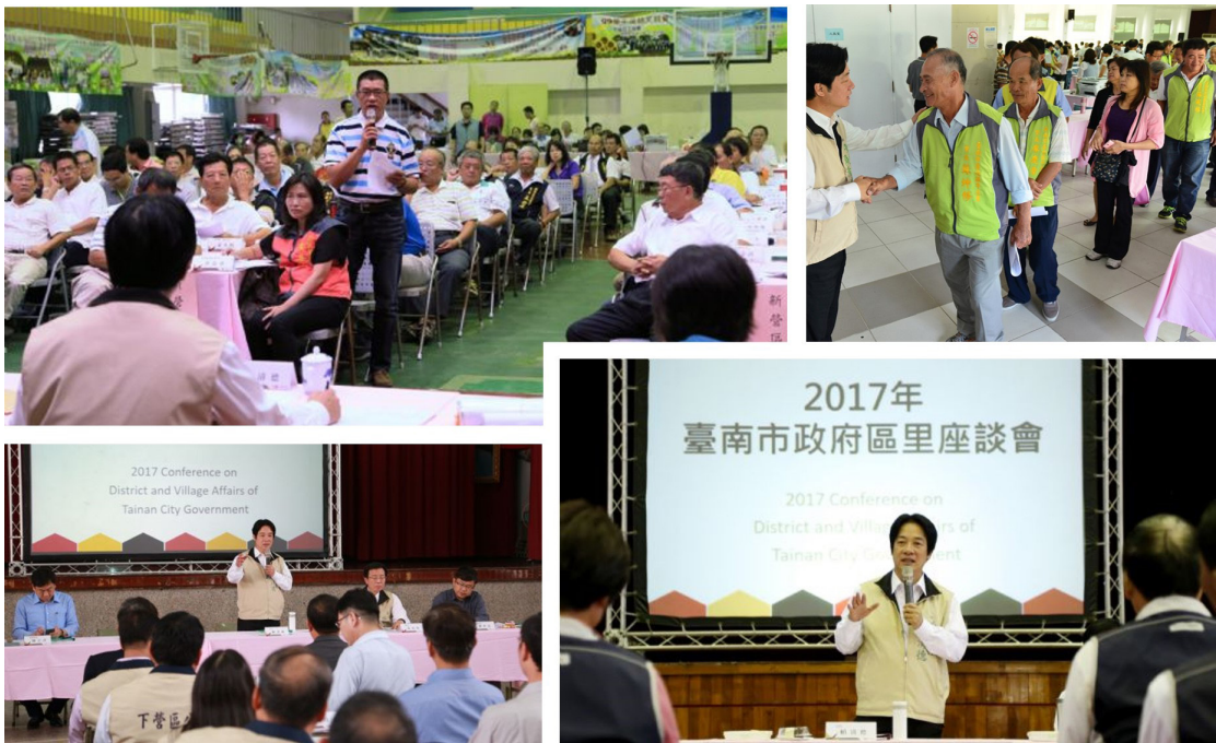
圖 2 區里座談會現場，地方意見領袖發言踴躍且與市府團隊互動熱絡