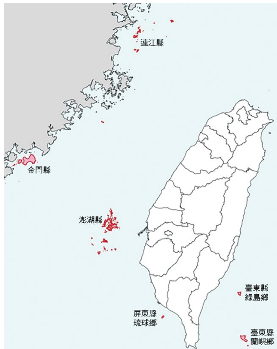
圖 1 臺灣主要離島地區

等地區，為有居民設籍且有常住人口之行政區域。由於地理環境區隔，加以過往戰亂影響，離島地區相較於本島，發展上較為受限，為推動離島開發建設，健全產業發展，維護自然生態環境，保存文化特色，改善生活品質，增進居民福利，行政院於2000年訂定《離島建設條例》。