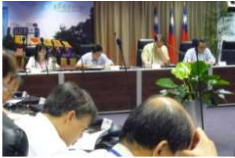
本府標案督導會報