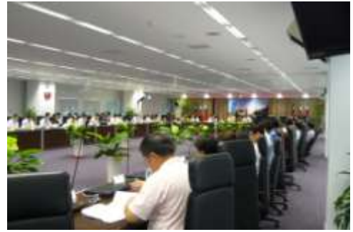
本府標案督導會報