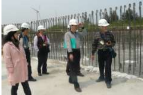
103 年 3 月 20 日年終考核 高美濕地公園工程

定，本府研考會業於 103 年 2 月 27 日及 3 月 6、7、13、20 及 21 日舉辦年終考核工作，聘請專家學者組成年終考核小組，選列 12 項重大工程進行考核，並列出優缺點及建議事項供各執行機關檢討改進。