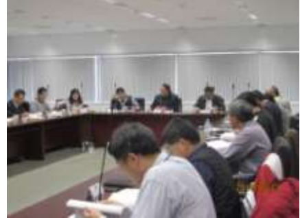
年終考核檢討會議