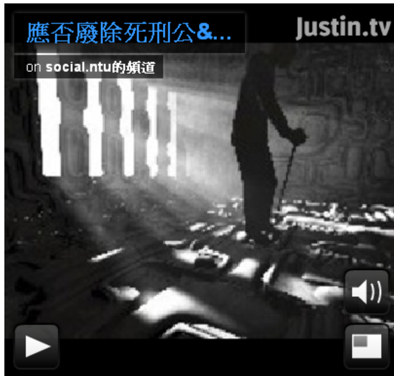
Watch live video from social.ntu的頻道 on Justin.tv

張貼者： 性交易應不應該被處罰-公民會議 位於 下午 7:40 0 意見 標籤： 會議資訊